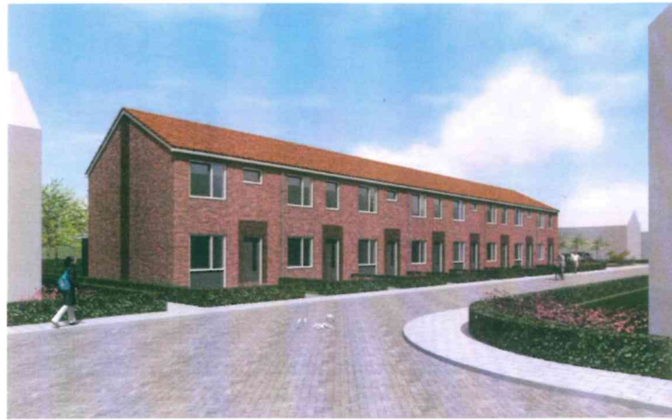
Impressie van de woningen

De woningen zullen in een ononderbroken rij worden uitgevoerd met een voorgevel die in lijn ligt met de bestaande woningen. Het huidige parkeerterrein wordt opnieuw ingericht en biedt plaats aan 17 auto's. Achter de woningen wordt een ruimte gereserveerd voor een rustig en veilig gelegen speelruimte waar kinderen kunnen spelen en beschermd zijn van het verkeer. Hieronder zijn een impressie van de situatietekening en de woningen weergegeven. Beide schetsen zijn een impressie en kunnen op onderdelen nog aangepast worden. Er kunnen geen rechten aan worden ontleend.