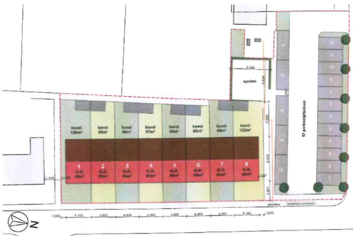
Situatietekening (onder voorbehoud)