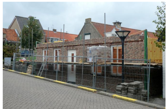
De voortgang op de kop van de Voorstraat

Voor de meest actuele informatie: Zie onze websire: www.swaneblake.nl