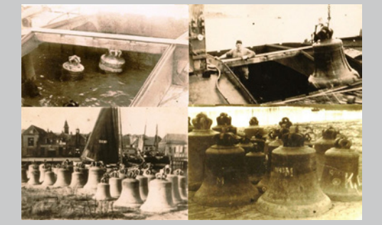
Na de berging in Urk uitgesteld op het strand.