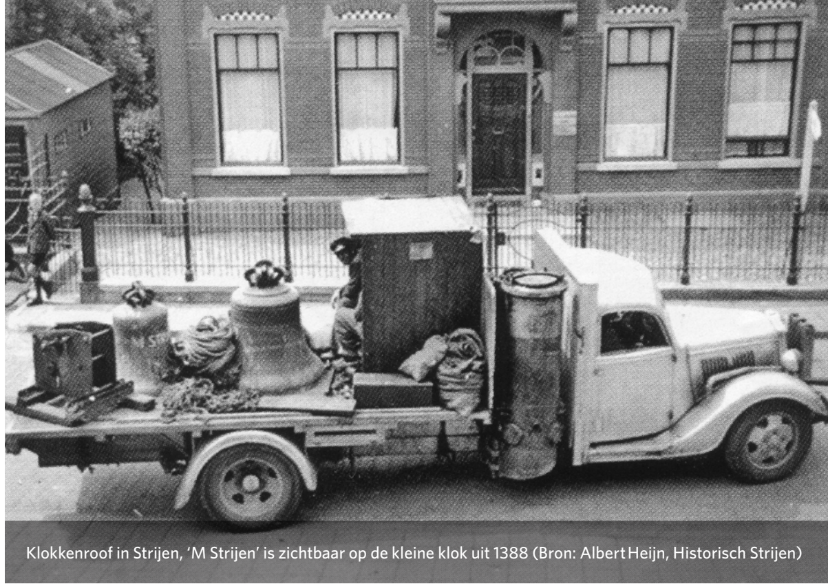
Klokkenroof in Strijen, 'M Strijen' is zichtbaar op de kleine klok uit 1388

De geroofde klokken werden verdeeld over diverse opslagplaatsen, de M-klokken werden zo waar apart opgeslagen. Ook werd een nadere inspectie gegund, klokken met een P (Prüfung) kregen uitstel. De rest werd vanaf maart 1943 vervoerd naar Hamburg om te worden omgesmolten. De transporten lagen onder vuur van de geallieerden, met herovering en vernietiging van klokken als gevolg. Het plan van de M-markeringen werkte aanvankelijk, maar na de invasie in