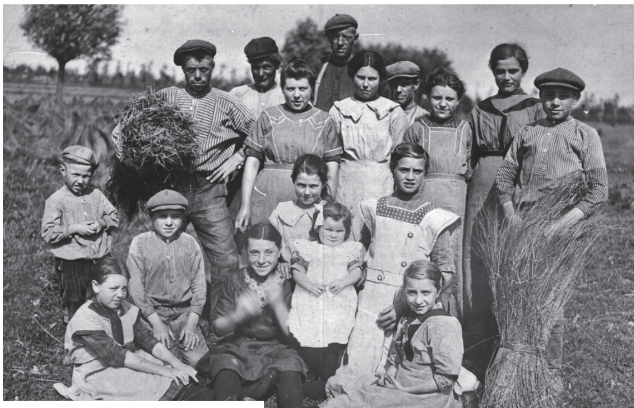
Vlaswerkers in Piershil, 1917