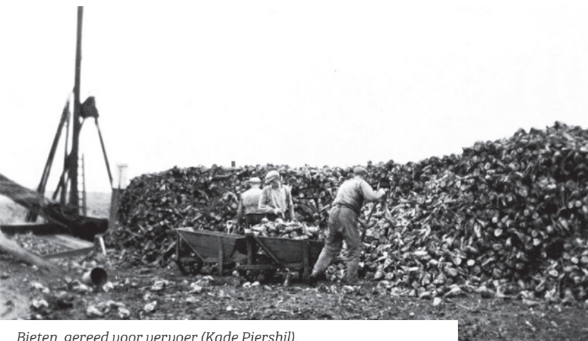
Bieten, gereed voor vervoer (Kade Piershil).