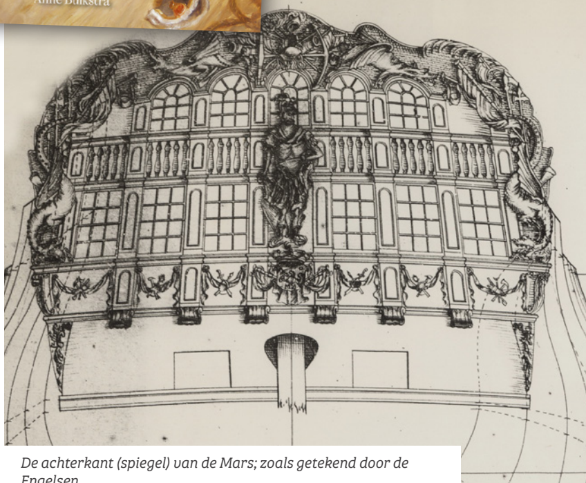
De achterkant (spiegel) van de Mars; zoals getekend door de Engelsen.

De helft van het boek bestaat uit het verhaal van de Mars, de andere helft is het verhaal van de bemanning geworden. Die combinatie zorgt voor een heel bijzonder boek. Ik hoop dan ook dat het na de boekpresentatie landelijk zal worden opgepakt. Dit unieke