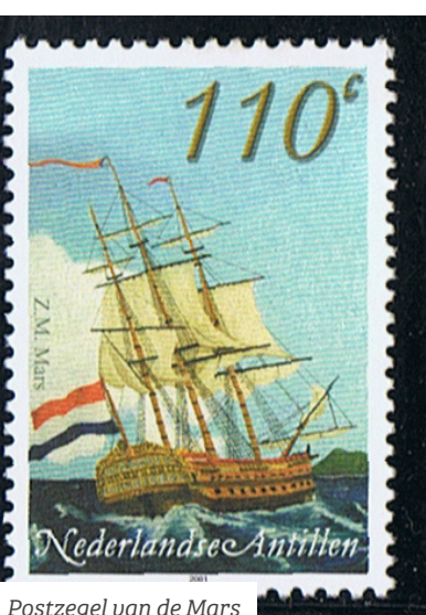
Postzegel van de Mars

Liefst veertig. Best veel, maar dat had een bijzondere reden. In september 1780 kwam het schip aan op St. Eustatius, twee weken voor de Grote Orkaan. De meest dodelijke orkaan ooit, waarbij meer dan 20.000 doden vielen. Er zijn toen veel schepen vergaan op