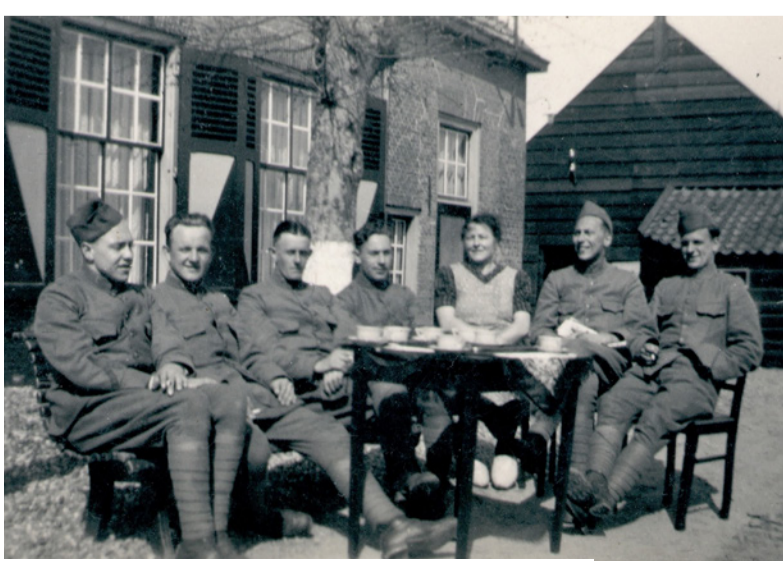
Nederlandse soldaten op de thee, Kostverlorendijk Piershil.

“ Alle kasten, laden en spaarpotten waren opengebroken, veel spullen lagen op de vloer...”