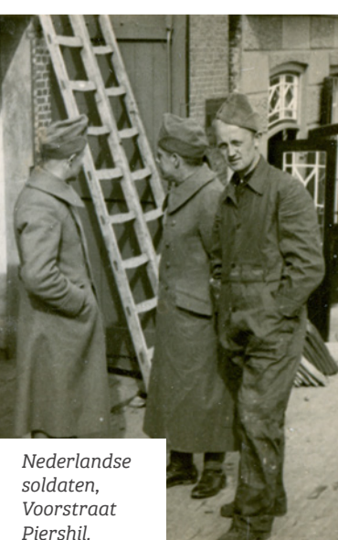
Nederlandse soldaten, Voorstraat Piershil.

“Op donderdag 16 mei kwam ik tot de ontdekking dat de staf Groep Spui in het gemeentehuis van Piershil gehuisvest was. Tegenover heren Officieren heb ik mijn ontstemming uitgesproken en hen verzocht zo spoedig mogelijk naar een andere bureaugelegenheid uit te zien. Op de bovenzaal van het gemeentehuis had ik een hele verzameling van de burgers ingenomen geweren en munitie liggen. Ook deze zaal was in gebruik genomen door stafpersoneel. Ik heb hen als hoofd der politie opgedragen deze verzameling onaangeroerd te laten. Toen ik de volgende dag weer ter plaatse was bleek alle munitie verdwenen, alsmede een slachtoparaat en enkele kleine vuurwapens. De staf officieren ontkenen de order tot inneming te hebben gegeven, de soldaten verklaarden dat hen was opgedragen alle munitie in te nemen. Het ligt in mijn bedoeling om de waarde van de verdwenen voorwerpen door te geven aan het Departement van Defensie. Pas op 20 mei werd het gemeentehuis door de staf ontruimd waarna het secretarietwerk weer doorgang kon vinden”.