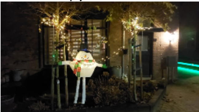
3e prijs: Julianastraat 11