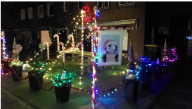
1e prijs: Julianastraat 4

We zijn van plan er een traditie van te maken, dus kan iedereen vast aan de slag met denken en plannen maken.